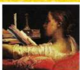
Biblioteca Comunale "Gianni Rodari"

VIA SETTEMBRINI SAN MARIANO DI CORCIANO (PG) TEL. 075/5188291 BIBLIOTECA@COMUNE.CORCIANO.PG.IT HTTPS://WWW.FACEBOOK.COM/BIBLIOTECA.CORCIANO