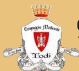
Compagnia Medievale Todi